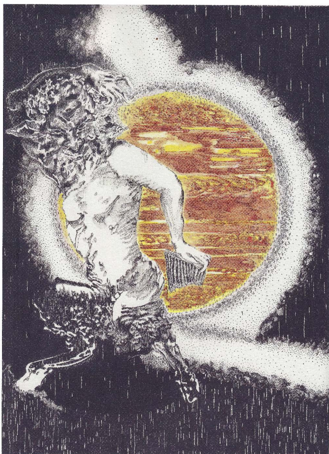
Peter Depelchin - Hommage à Pan II, mixed media on Arches cream paper, 2020, 31x20cm